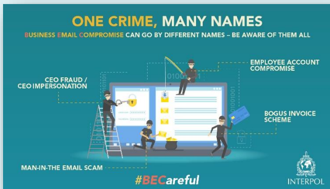
Figur 3 Mange navn - én forbrytelse

BEC-angrep er ofte veldig skjult, med angripere som gjemmer seg ved å blande seg i legitim trafikk ved hjelp av IP-områder med høyt omdømme og ved å utføre diskrete aktiviteter på bestemte tidspunkter og innen spesielle forbindelser. BEC-angrep kan dessverre forbli uoppdaget til de forårsaker reelt store økonomiske tap. Dette på grunn av begrenset eller delvis synlighet fra sikkerhetsløsninger som ikke drar nytte av omfattende synlighet i e-posttrafikk, identiteter, endepunkter og skyadferd,