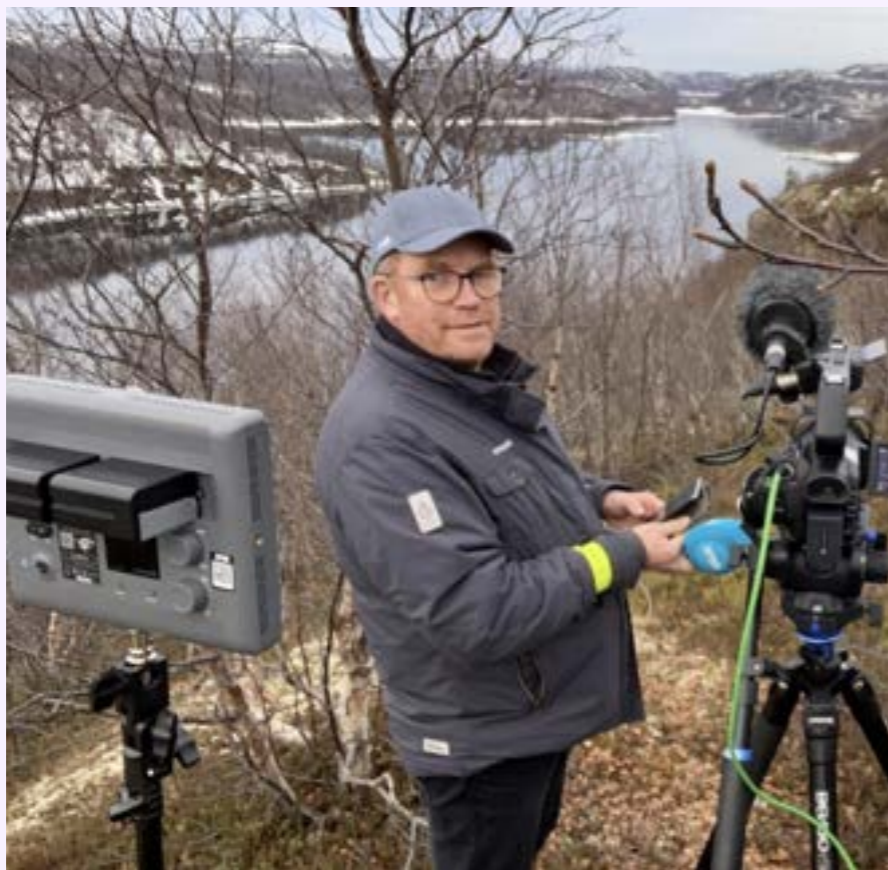
Ved Boris Gleb med den norsk-russiske grensa i bakgrunnen.

Av Marte Lindi, distriktsredaktør i Finnmark