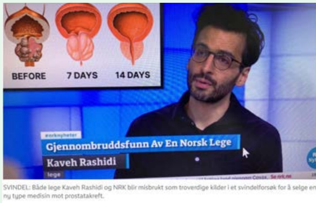
Skjerm bilde av falsk annonse.

NRK har høy troverdighet i befolkningen, og dette misbruker trusselaktører i bedragerier, i reklamer for egne produkter eller i desinformasjonskampanjer.