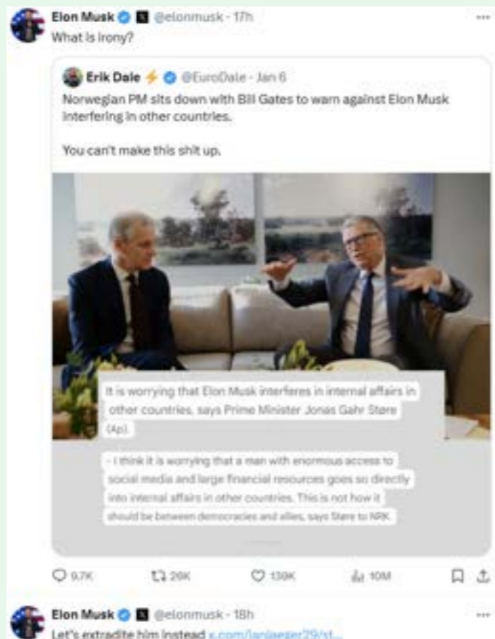
Skjerm bilde fra X januar 2025

Desinformasjon er en stor utfordring. I løpet av sekunder kan usann eller villedende informasjon spres til millioner og skape motsetninger og uro. Slik informasjon har ofte til hensikt å villede, og kan få betente politiske uenigheter ut av kontroll.