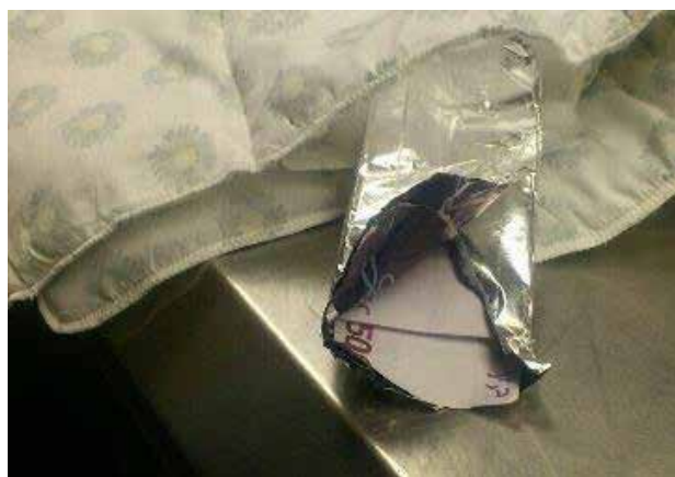
Valuta avdekket i dyne.

Hvert år avdekker tollvesenet betydelige pengesummer som ikke deklarerer ved grensepassering til eller fra Norge. En grunn til at valuta ikke deklarerer, kan være et ønske om å unngå sporing av midlene, i mange tilfeller fordi midlene kan knyttes til straffbare forhold eller at valutasmuglingen er en del av en hvitvaskingsprosess. Ifølge tollloven 30 plikter man å deklare alle beløp større enn NOK 25 000. Det mistenkes imidlertid at også deklarerer penger kan stamme fra kriminell virksomhet. I så fall kan deklarasjonen være et første hvitvaskingskritt. I løpet av 1. halvår 2014 beslagla tollvesenet 28,5 31 millioner norske kroner (445 beslag), mot 21 millioner (402 beslag) i 2013. 32 Det er imidlertid meget sannsynlig at det totale beløpet som føres ulovlig ut av Norge, er betydelig større.