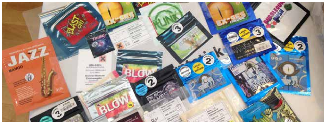
I 2013 ble det gjort 620 beslag av nye psykoaktive substanser, fordelt på 91 ulike stoffer.