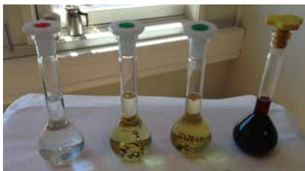
Amfetaminbase kommer i forskjellige typer og styrkegrader.

Antallet hasjbeslag i Norge holder seg stabilt, mens det er 24 % økning i beslag av marihuana og cannabisplanter det siste året. 47 Flere politidistrikter rapporterer at de har avdekket cannabisplantasjer av varierende størrelse det siste året. Marihuana og cannabisplanter utgjør nå hele 40 % av de samlede cannabisbeslagene.